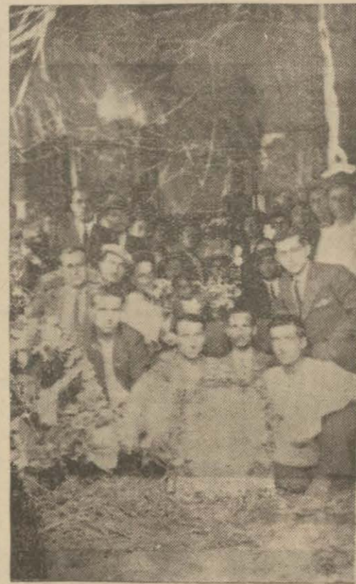
Sincak halkı bayram günü süslü otomobillerle şehirlere nakledildiler