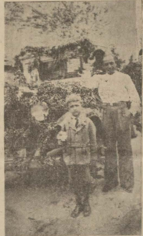
Sincakta bayram gününün bir başka intibahı