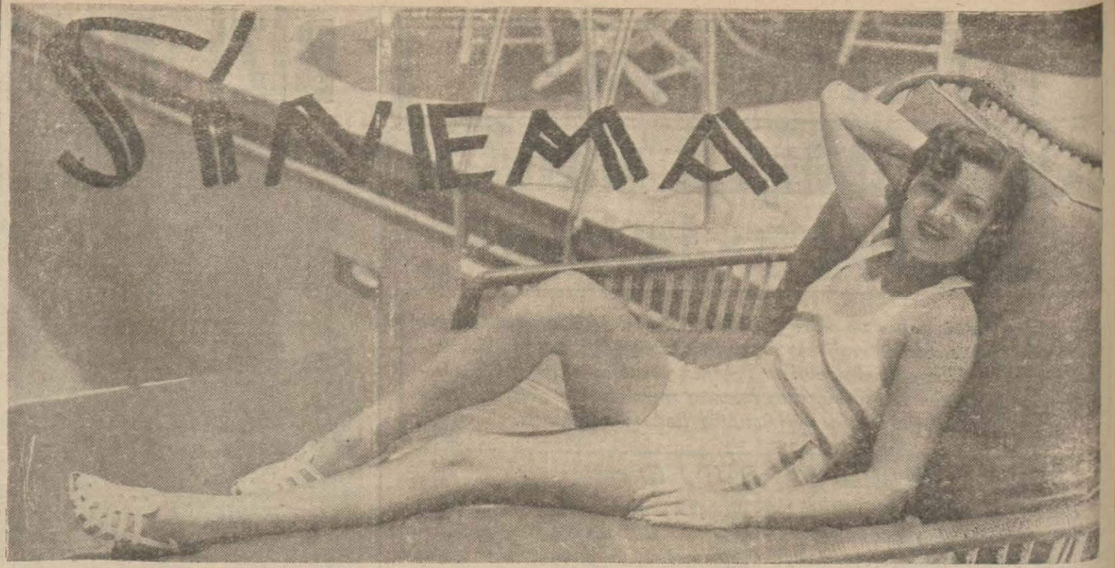
«Yirminci asır — Foks» un güzel yıldızlarından: Arlin Jüdge