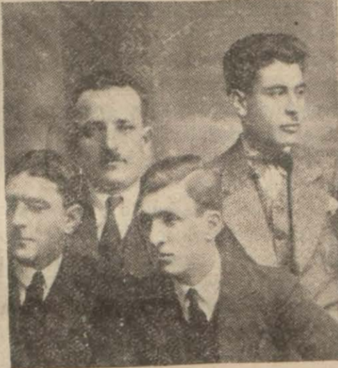
Bayburtlu Zihninin kemiklerini Bayburda götüren heyet

Maçka (Hususî) — Halk şairi merhum Bayburtlu Zihninin Maçkadaki mezarında bulunan kemikleri Bayburda nakledilecektir. Bunun için Maçkaya bir heyet gelmiştir. Heyet merhumun Olsadağı kabrine giderek kemikleri ile ayak taşını alarak Bayburda avdet etmiştir. Bu heyet aynı zamanda şairin eserlerini de toplamak üzere çalışmaktadır. Şair Maçka havalisinde Zihni Baba diye tanınmış olup irticalen söylediği şiirleri el'an halk arasında dilden dile dolaşmaktadır.