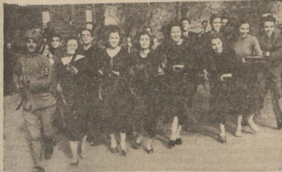
Manga kolu halinde hücum