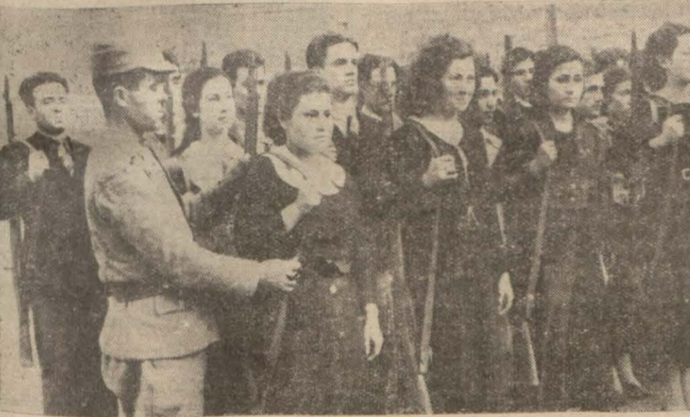
Manga hazır ol vaziyette