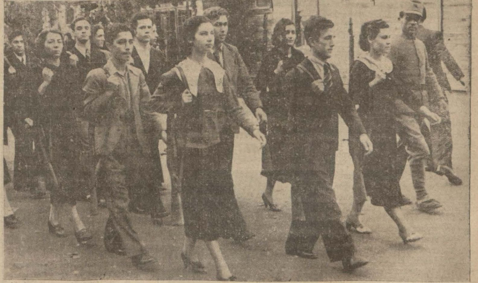
Şehrimizdeki hususî mekteplerden birinde askerlik derslerine kız talebeler de iştirak etmeğe başlamışlardır. Resimlerimiz bu mektepte dünkü askerlik dersi esnasında alınmıştır.

Londra, 11 (Hususî - Röyter ajansı bildiriyor) — Moskovada çok şumullü bir faşist şebeke meydana çıkarılmıştır. Halk arasında büyük bir heyecan uyandıran ve nefretle karşılanan bu hâdise dolayısıyla bir çok kimseler tevkif edilmiştir. Tevkif edilenlerin adedi henüz belli değildir. Mevkuflar arasında Almanlar, Avusturyalılar, İsviçreliler ve Lehliler de bulunmaktadır. İlk tahkikat neticesinde şebeke mensuplarının mühim ifşaatta bulunacakları söylenmektedir.