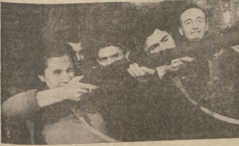
Eskin nişanct nişan alıyor

Hususî bir mektepte dünkü askerlik dersine iştirâk eden genç kızların talimlerinden görünüşler