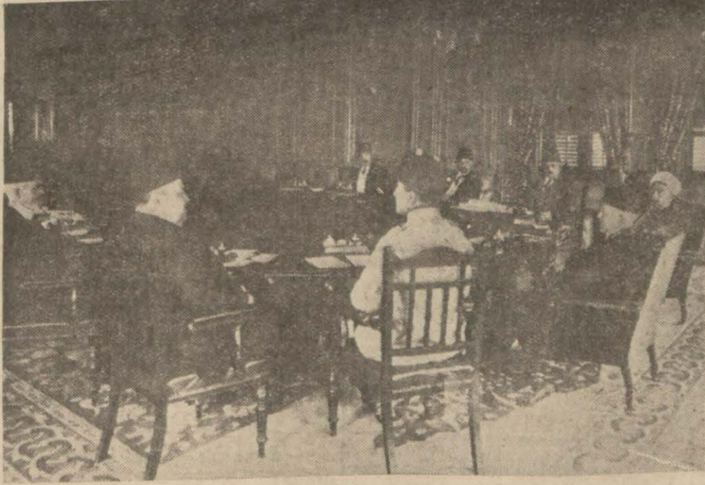
Enver ve Talât Paşaların hazır buldukları bir kabine toplantısı

Bu hareketin içindeki insanları birbirlerine derece derece yaklaştıran, de-