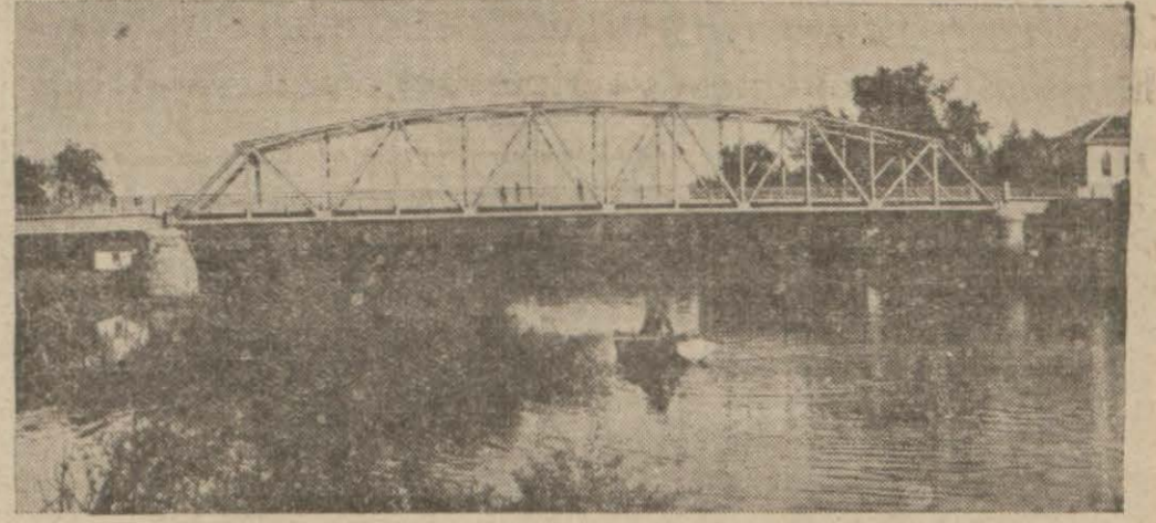
Manavgatta 120 bin li raya yaptırılan köprü

Manavgat arazisinin en mümbit ve en mühim kısmı bir ailenin elinde bulunmaktadır. Kurutulan bir bataklığın arazisi halka dağıtılacak