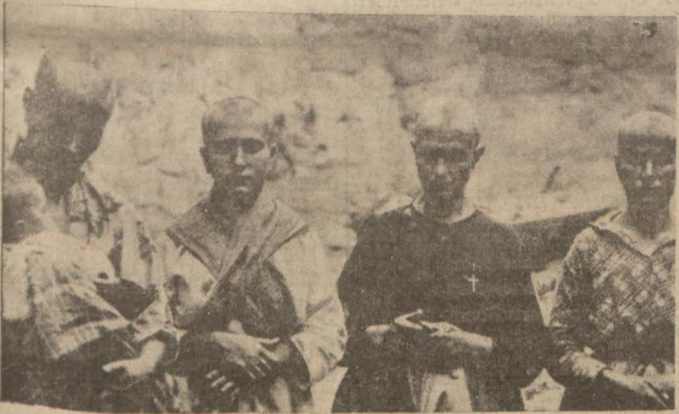
Resimde görülen İspanyol kadınlarının saçları âsiler tarafından kesilmiştir. Kadınların bu cezaya çarptırılmasının sebebi bir âsi müfrezesini pusuya düşürmek teşebbüsünde olmalarıdır. [Yazısı 10 cu sayfada]

İngiliz sefarethanesine bombalar düştü. Âsi tayyareler şehre torpil yağdırdılar. Bir tayyare cadde üstüne düştü